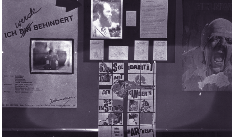
Die Fotoausstellung von Otto Anlander über das Institut Hartheim war Teil einer Hausarbeit an der Pädagogischen Akademie in Wien. Als die Wanderausstellung an die PädAk Linz kam, wurde sie 1983 beschlagnahmt | Foto: Otto Anlander.

Im Februar 1983 ließ der Trägerverein ein Plakat mit der Aufschrift „Solidarität mit den Kindern des Instituts Hartheim“ sowie eine Presseinformation der AKN polizeilich beschlagnahmen. In weiterer Folge wurde im Auftrag der Institutsleitung eine Fotoausstellung, welche die von den