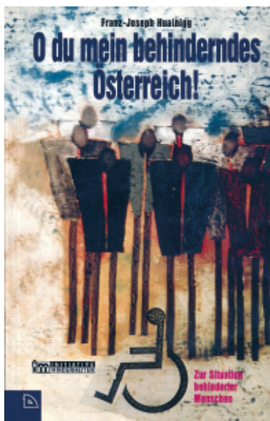
O du mein behinderndes Österreich. Zur Situation behinderter Menschen. Von: Franz-Joseph Huainigg (Hg.). Klagenfurt: Drava Verlag 1999.