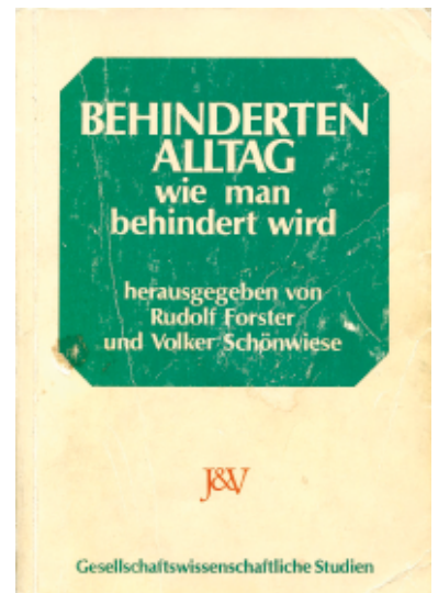
Behindertenalltag. Wie man behindert wird. Von: Rudolf Forster und Volker Schönwiese (Hg.). Wien: Jugend&Volk 1982.