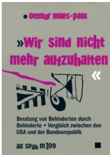
Wir sind nicht mehr aufzuhalten. Behinderte auf dem Weg zur Selbstbestimmung. Beratung von Behinderten durch Behinderte. Vergleich zwischen den USA und der BRD. Von: Ottmar Miles-Paul. Neu-Ulm: AG Spak 1992.