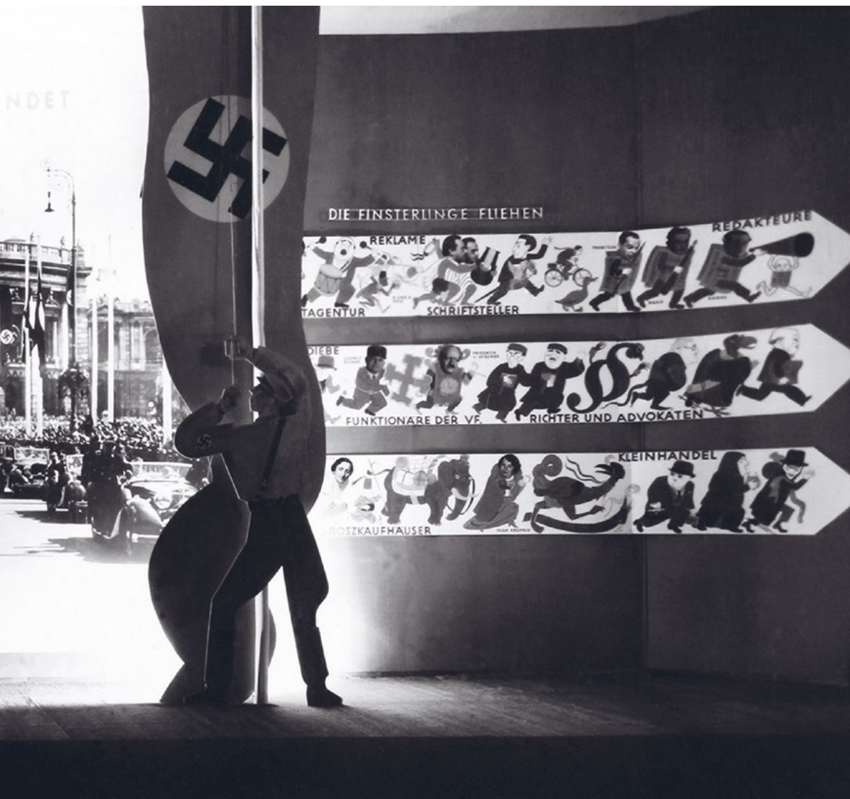
Die in die Flucht geschlagenen Juden und Jüdinnen und der Einzug Hitlers als strahlende Apotheose und Schlussbild der Wiener Erweiterung der Ausstellung „Der ewige Jude“ am Nordwestbahnhof. Foto: ÖNB-Bildarchiv Austria 1938 Medien-Nr.: 00208611.

Emigration jüdischer Familien; ihr Hab und Gut wurde oft schon im Zuge der beauftragten Übersiedlungen in den Lagern der arisierten Speditionen geraubt. [4]