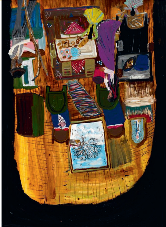
Ceija Stojka, ohne Titel, 1995

ORTE DER ROMA UND SINTI 12.2. BIS 17.5.2015