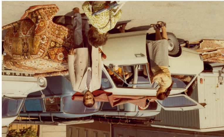
Teppichhandel, um 1970

Im Mittelpunkt der Ausstellung stehen als Gegenperspektiven zehnte Beiträge von Menschen aus der Roma-Community, die ihrer Familiengeschichte nachgingen, sich mit ihrer Identität auseinandersetzen oder für die Ausstellung recherchieren. Videointerviews machten oder künstlerische Beiträge lieferten. Von der schmerzhaften persönlichen Erfahrung mit dem Holocaust zeugen Gemälde von Ceija Stojka, die vom Wien Museum erworben wurden. Aus der Vielschichtigkeit der Geschichten ergeben sich neue Sichtweisen, die klischeehafte Wahrnehmungen durchbrechen.