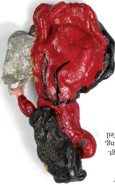
Ceija Stojka, Romni, Salzteigfigur

Darstellungen von Roma und Sinti stammten über Jahrhunderte hauptsächlich von Nicht-Roma. Dazu gehören romanisierende Vorstellungen ebenso wie Bilder der Verachtung. Es existieren kaum historische Selbstzeugnisse. Auf diese Weise wurden Stereotype und Feindbilder festgeschrieben, die letztlich der Legitimation von rassistischer Verfolgung dienen und weiterhin dienen.