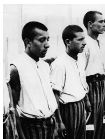
Konzentrationslager Dachau, 20. Juli 1938