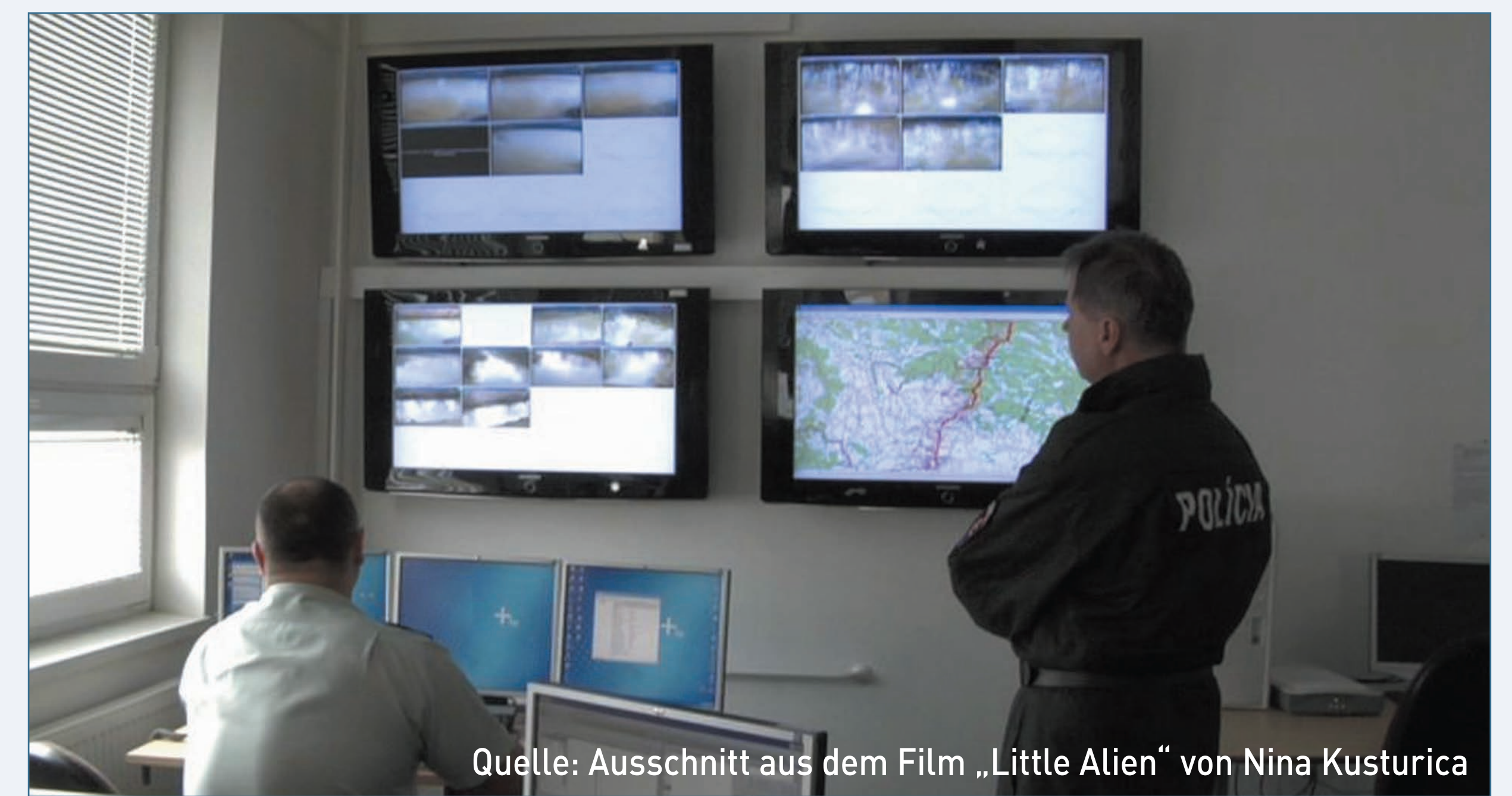
Verstärkte High-Tech-Kontrollen an den EU-Außengrenzen