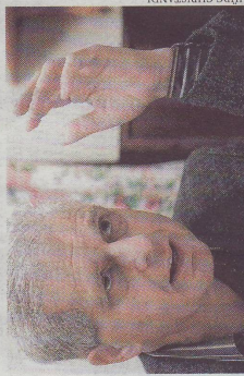
Caritas-Chef Küberl kritisiert Maria Fekter

Küberl lobt, dass auf lokaler Ebene schon viel für eine bessere Integration geschehe – Positivbeispiele seien die beiden Städte Dornbirn und Kapfenberg.