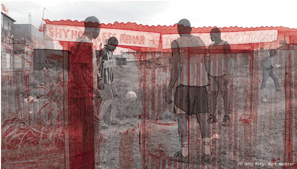
FC SHY

Olympiasiegers im Eisschnelllauf, Olav Koss, oder auch Stiftungen wie Laureus , hinter der Mercedes und Vodaphone stehen (vgl. Levermore 2011). Auch die großen Sportorganisationen wie FIFA und das IOC gehören zu den treibenden Kräften der neuen Bewegung. Beispielsweise finanziert die FIFA maßgeblich die NGO streetfootballworld , die von Berlin aus weltweit mit 85 Netzwerkpartnern kooperiert.