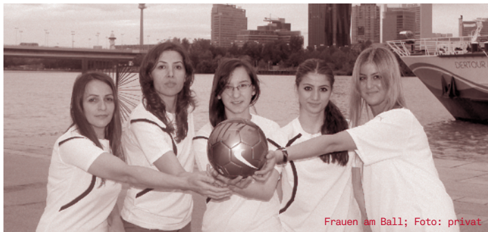
Frauen am Ball; Foto: privat

Der Österreichische Integrationsfonds (ÖIF) zeichnet gemeinsam mit dem Bundesministerium für Inneres (BM.I) Sportprojekte aus, die die Integration von Migrantinnen und Migrantinnen durch Sport fördern. Partner sind das Sportministerium, die Bundes-Sportorganisation (BSO) sowie die Bundesschülervertretung. Für 2013 sind insgesamt €15.000 für die Gewinnerprojekte vorgesehen.