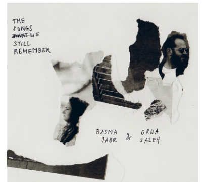
The Songs We Still Remember. Von: Basma Jabr & Orwa Saleh. 8 Titel, 54 Minuten. recordJET 2019. ASIN: B081VR9BRJ