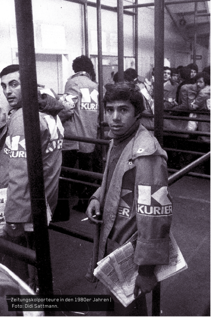
Zeitungskolporteur in den 1980er Jahren