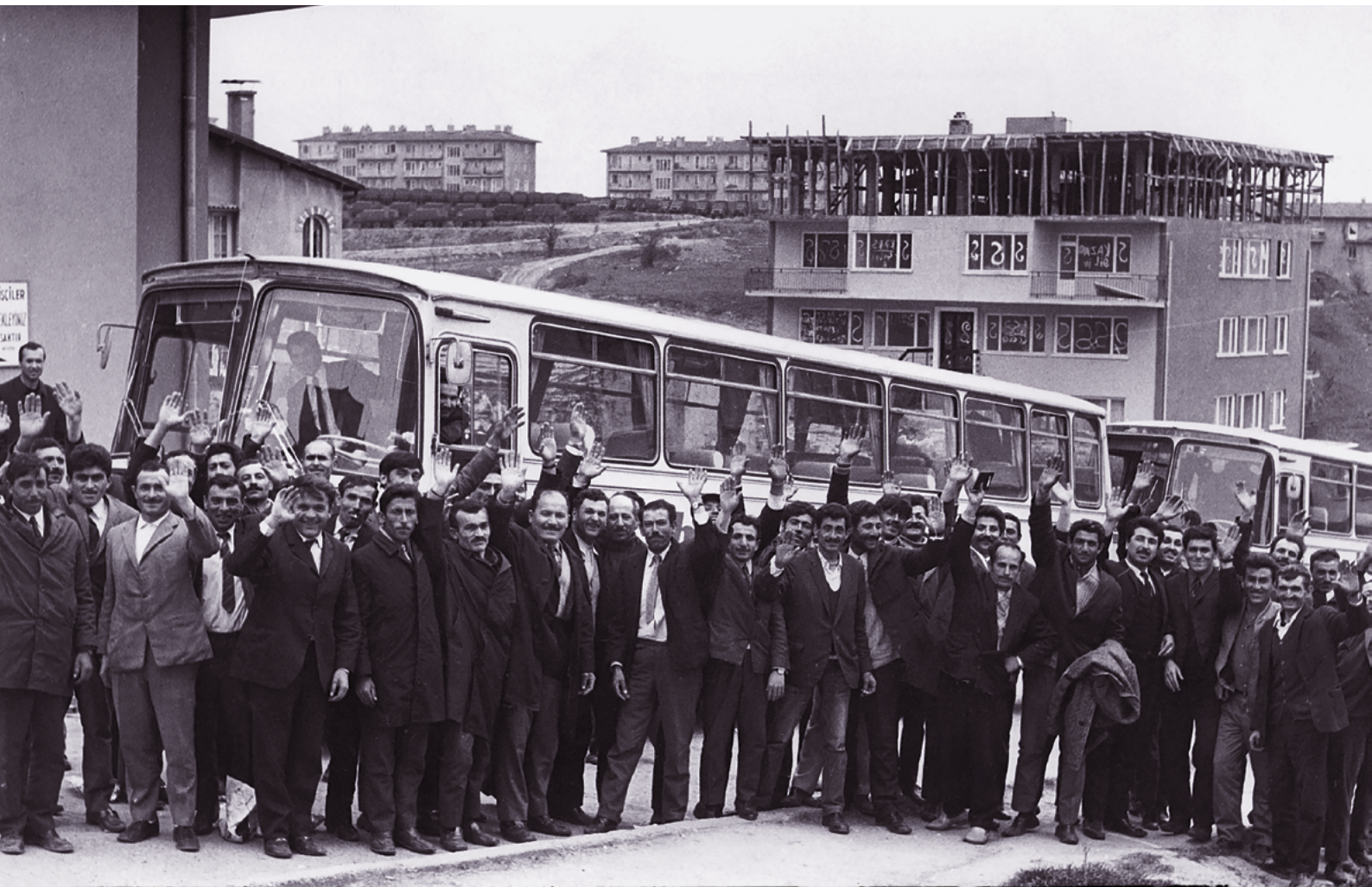
Der Abschied | Der erste Bustransport nach Österreich 1971