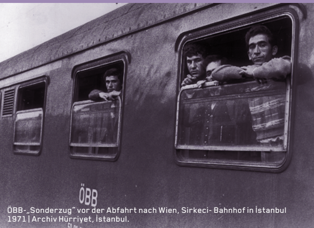
ÖBB-„Sonderzug“ vor der Abfahrt nach Wien, Sirkeci-Bahnhof in Istanbul 1971

*Gastarbeiter: serbokroatisches Lehnwort, mit dem im ehemaligen Jugoslawien Arbeitsmigrant*innen bezeichnet wurden, die seit den 1950er Jahren nach Deutschland und ab 1964 nach Österreich gingen.