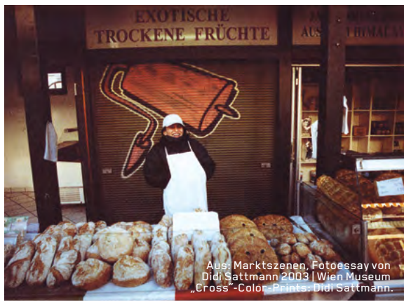
Aus: Marktszenen, Fotoessay von Didi Sattmann 2003 | Wien Museum „Cross“-Color-Prints: Didi Sattmann.