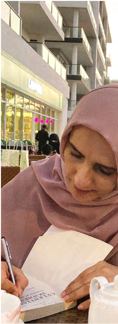
Omanische Autorin Jokha Alharthi

Erste Booker-Prize-Trägerin aus dem arabischen Raum